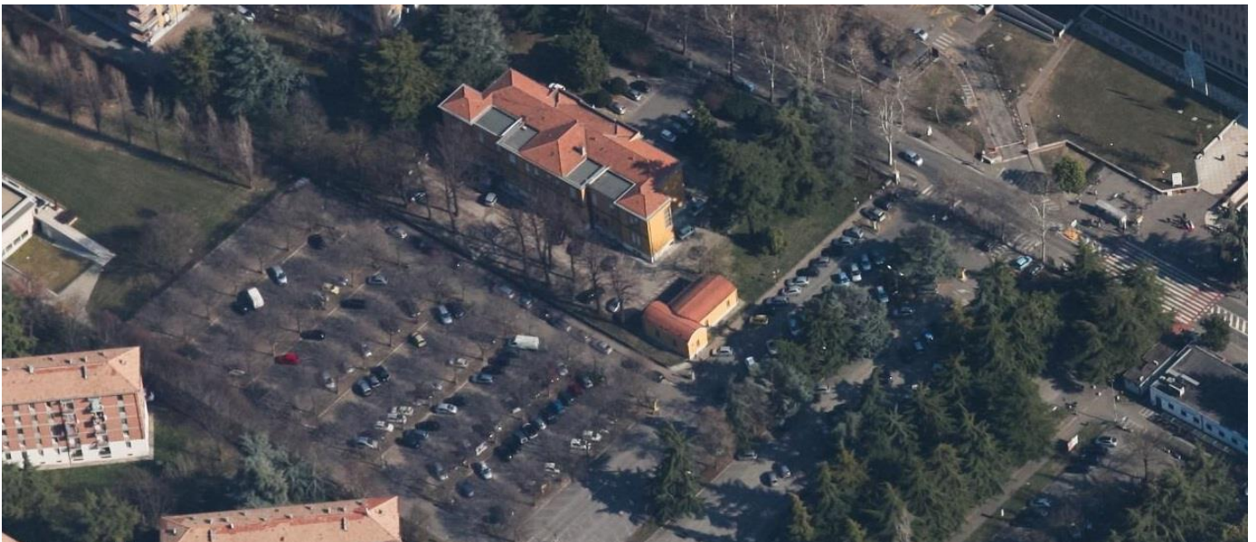
Vista assometrica dell'area di progetto