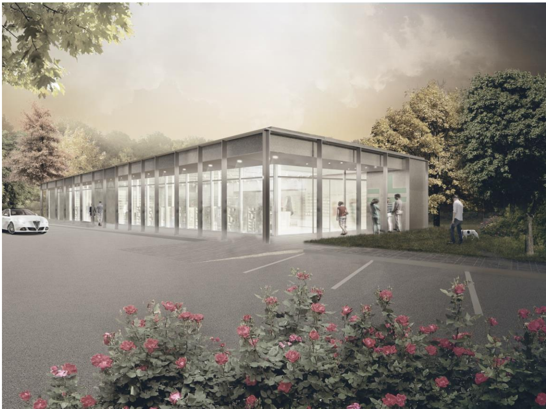
Vista fotorealistica dell'edificio in progetto

Queste premesse si concretizzano quindi in un edificio regolare e compatto, in grado di rispondere alle esigenze di chi ci lavora e di garantire un servizio di qualità alla clientela.