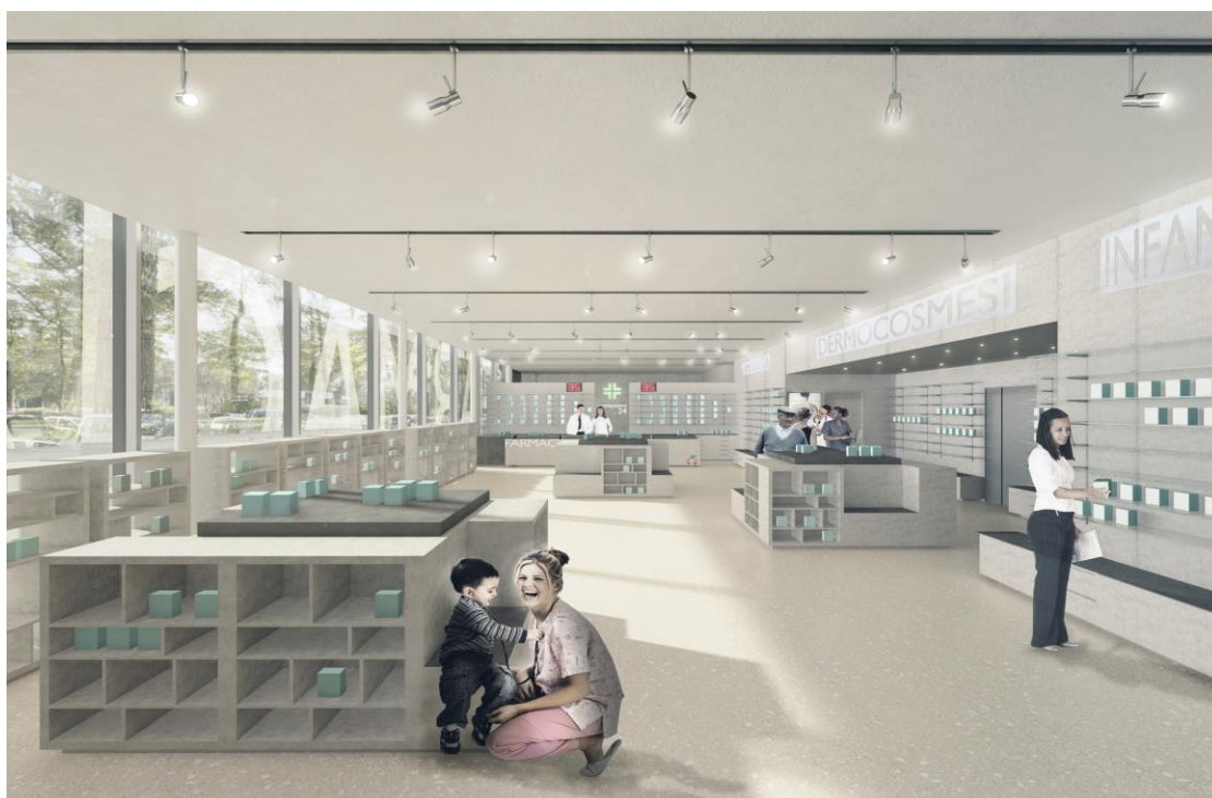
Immagine rappresentativa degli interni

La soluzione progettuale ha tra i suoi obiettivi principali quello di associare alla funzionalità la filosofia di massima riduzione dei costi attraverso le seguenti soluzioni: